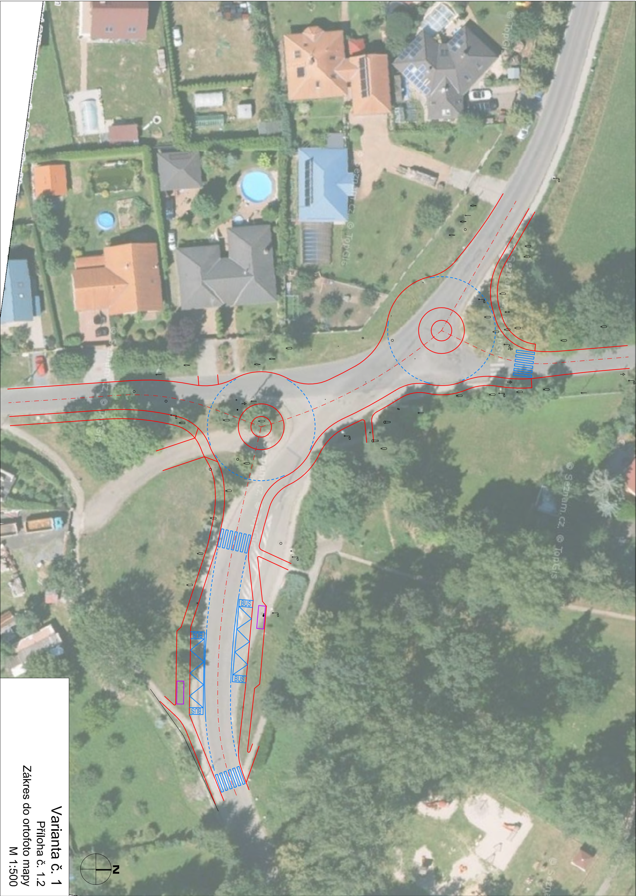
Varianta č. 1 Příloha č. 1.2 Zákres do ortofoto mapy M 1:500